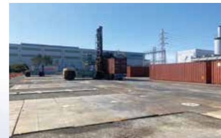
ヤードF (インランドコンテナデポ)