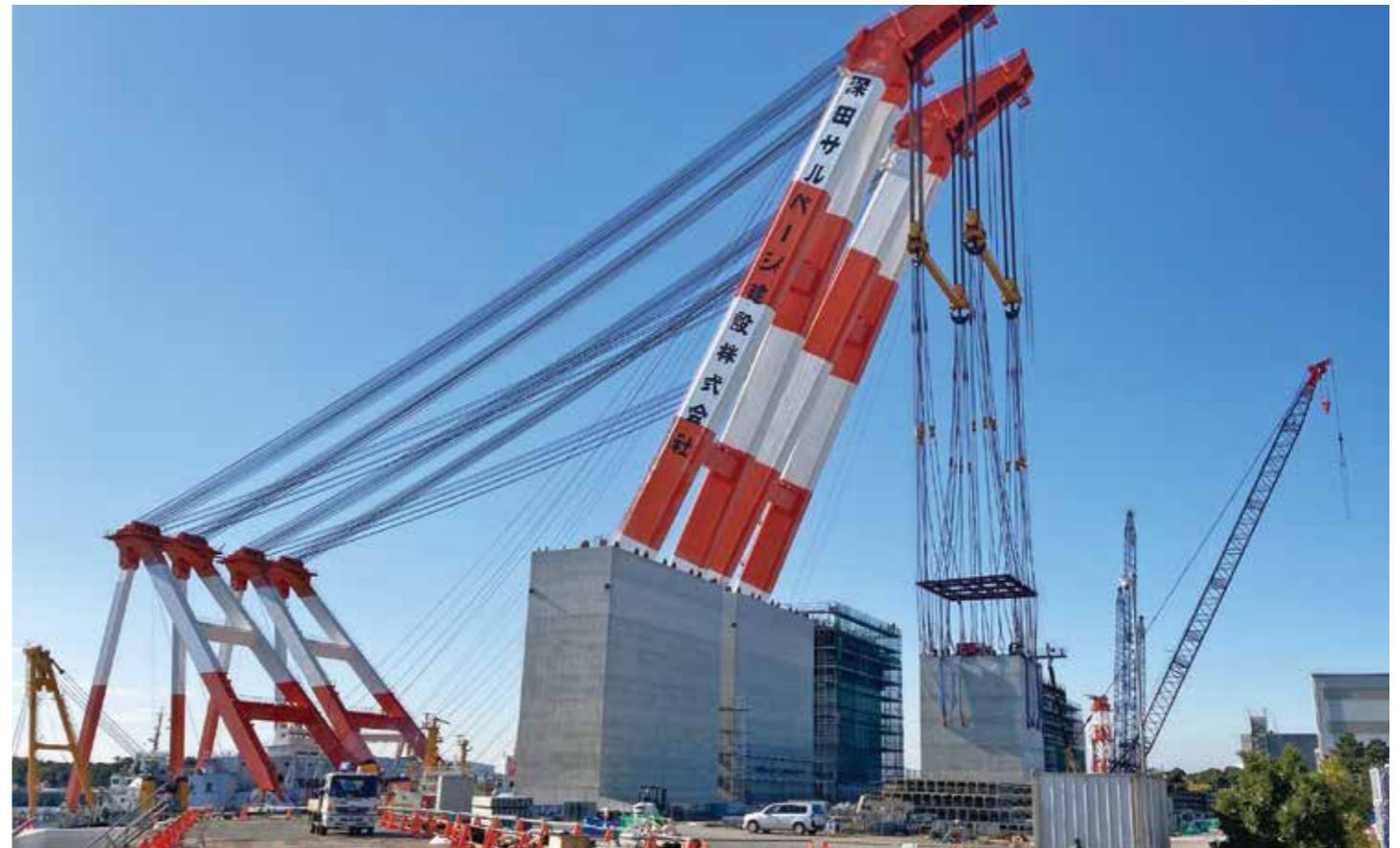
ヤードA (新本牧地区護岸ケーソン製作)